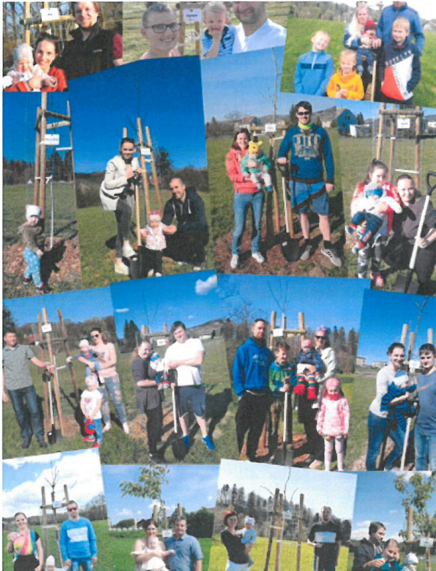
Tato akce je spolufinancována z rozpočtu Moravskoslezského kraje v rámci dotačního titulu Podpora dobrovolných aktivit v oblasti udržitelného rozvoje a Místní Agendy 21 pro rok 2020.

Výsadba stromů musela vzhledem k pandemické situaci proběhnout zcela jiným způsobem, než jsme byli doposud zvyklí. Výsadba proběhla bez přítomnosti veřejnosti, bez rodičů a prarodičů nově narozených dětí. Celkem bylo vysázeno 30 ovocných stromků. Rodiče dostali symbolicky rýč s vygravírovaným názvem akce a znakem obce a sami si vyhledali svůj stromek, ke kterému následně upevnili tabulku se jménem jejich dítěte. Starší sourozenci stromek vydatně zalili konvičkou, která jim byla dodána spolu s rýčem, tabulkou se jménem a mapkou s umístěním jejich stromku. Tato akce se již tradičně setkává s pozitivním ohlasem, o čemž svědčí i množství zaslaných fotografií.